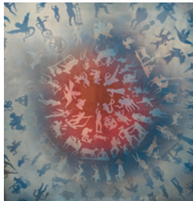
Willee WTH Regensburger | Alles kommt in die Welt Lack auf Karton Rahmen | 155 cm x 155 cm

Im Namen des Landkreises Traunstein laden wir Sie herzlich ein zur